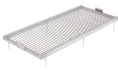
Griglia di cottura in acciaio inox aisi 304 con tondino Ø 8 brillantata.