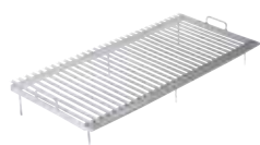
Griglia di cottura in acciaio inox aisi 304 con canaline di scolo brillantata.