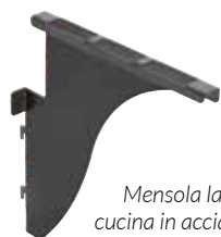
Mensola laterale per attacco set cucina in acciaio Corten spessore 2 mm, inseribile a destra o sinistra.