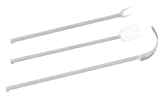
Set cucina comprensivo di forchettone, paletta, spostabracci realizzati in acciaio inox AISI 304 brillantati.